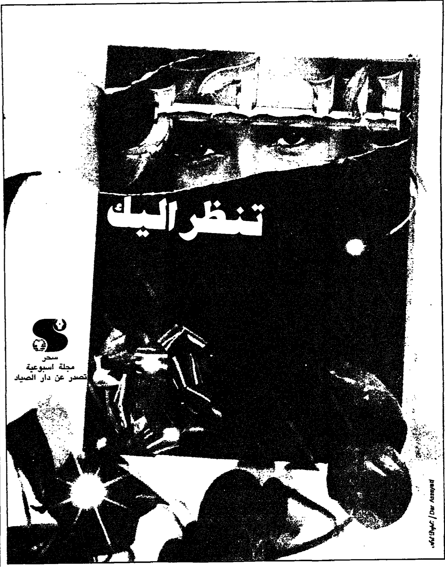
عبد الوهاب / دار الصياد